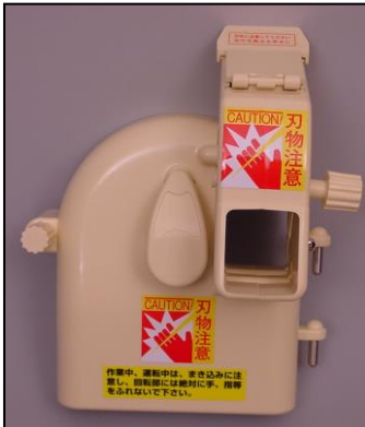
1)カバー部一式 部品番号:3892 ¥14,000