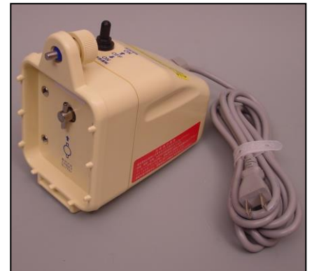
3)モーター部一式 部品番号:3893 ¥33,000