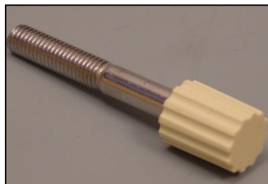
5)カバー止めネジ 部品番号:3920 ¥600