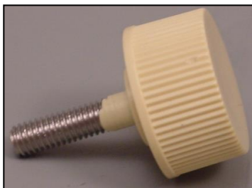
4)モーター止めネジ 部品番号:3884 ¥600