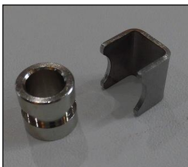
7)ストッパ-付きインサート(2個セット) 部品番号:3942 ¥1,600